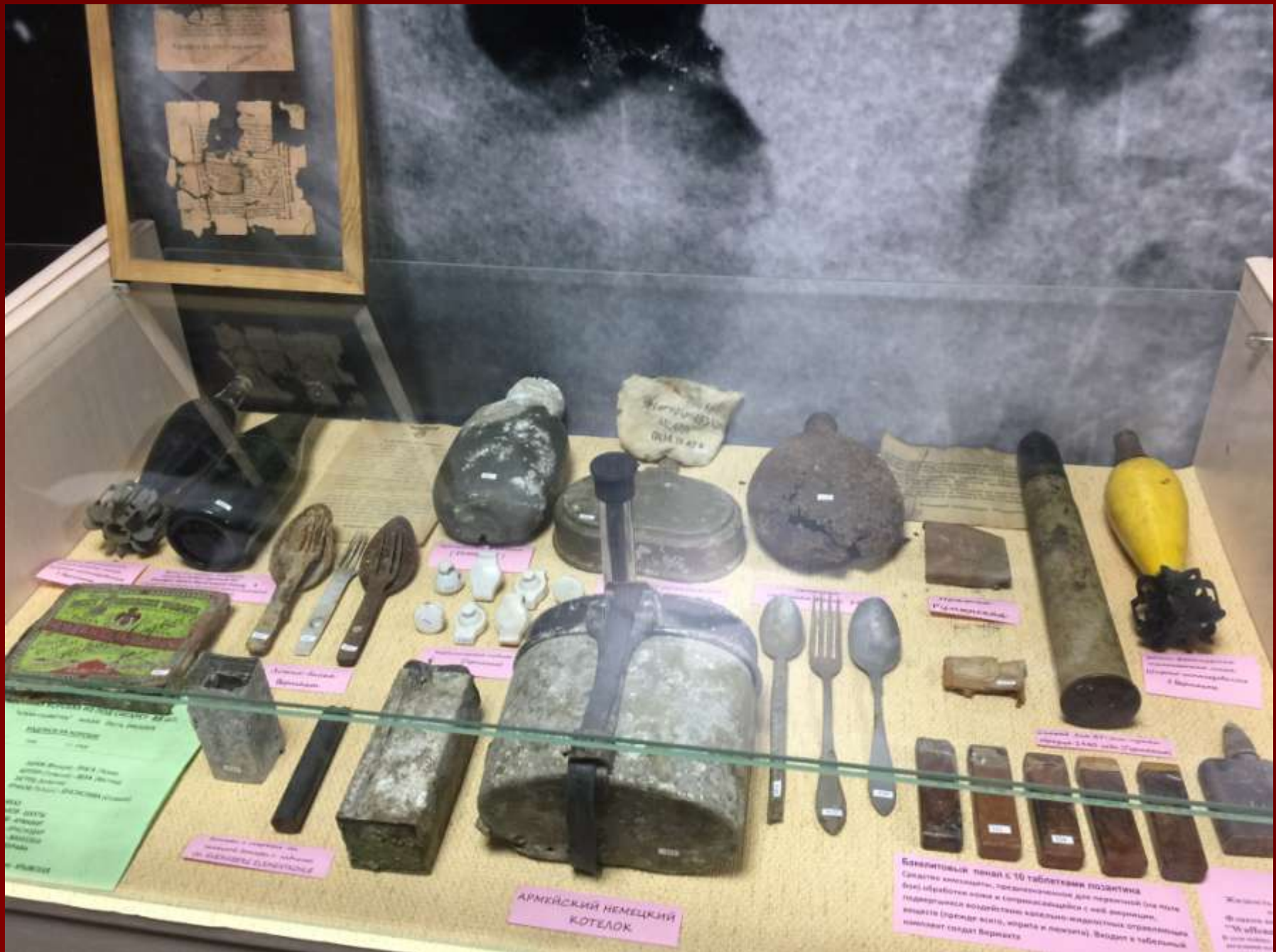
АРМЕЙСКИЙ НЕМЕЦКИЙ КОТЕЛОК